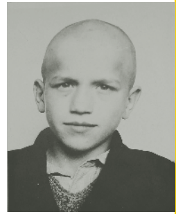
Foto aus der Krankenakte.