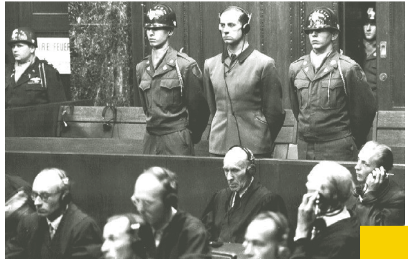
Nürnberger Ärzteprozess, Karl Brandt (stehend) bei der Urteilsverkündung, 20. August 1947

Erst in den vergangenen Jahren ist es gelungen, auf verschiedenen gesellschaftlichen Ebenen der Opfer der „Euthanasie“-Morde und der Zwangssterilisationen würdig zu gedenken. Gleichwohl ist die Anerkennung als NS-Opfergruppe bisher nicht erfolgt. 2021 haben die Fraktionen der SPD, von Bündnis 90/Die Grünen und der FDP, sich dazu im Koalitionsvertrag bekannt. Der Bundestag hat im Herbst 2022 mit den Anhörungen von Expert*innen begonnen.