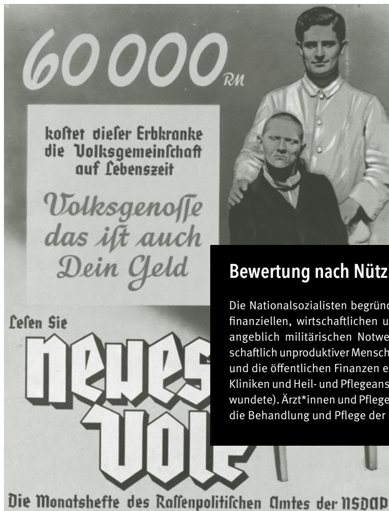
Propagandaplakat „Das ist auch dein Steuergeld“

Im Juli 1939 fanden Gespräche von medizinischen und politischen Eliten statt, bei denen die Patientenmorde geplant wurden. Wie viele Entscheidungen der Nationalsozialisten wurden die Mordtaten im Geheimen in Berlin geplant und erst mit Kriegsbeginn ab 1939 in die Tat umgesetzt. Im Oktober 1939 unterzeichnete Hitler ein Ermächtigungsschreiben zur „Euthanasie“. Ab 1940 diente die Villa (vormals jüdische Besitzer) in der Tiergartenstraße 4 (daher der Aktionsname T4) in Berlin als Verwaltungszentrale für die Planung der NS-„Euthanasie“-Morde. Die gesamte Aktion sollte vor der Bevölkerung geheim gehalten werden.